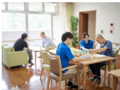
写真はいずれもイメージです

男性の半数以上は「配偶者に頼りたい」と思っているが、女性の6割近くは「ヘルパーなど介護サービスの人を頼りたい」と思っている。もちろん「夫の面倒もサービスの人にみてもらいたい」という人が多い結果でした。